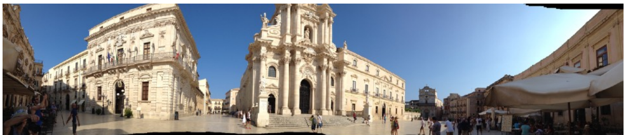
Place de Syracuse