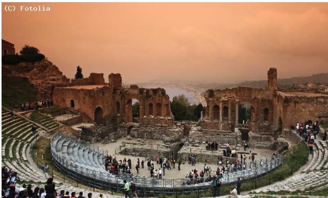
Théâtre Grec à Taormina