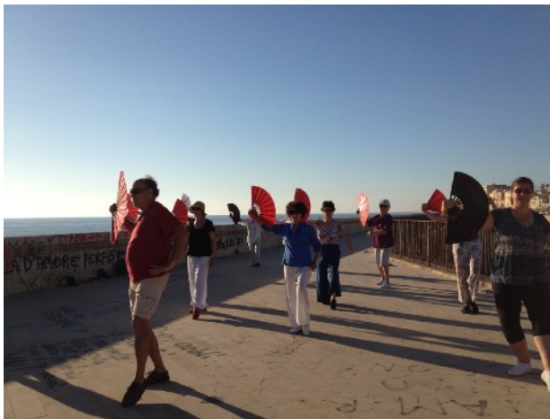
Le matin au levé du soleil

PS : en Sicile, la pratique s'adapte en fonction du soleil, à l'aube et au crépuscule... Top !!!