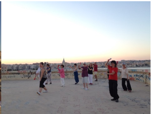
Le soir au coucher du soleil